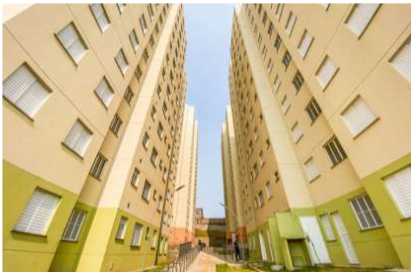
Ação da SEHAB - Novas moradias do Forte do Ribeira.

A Secretaria Municipal da Habitação (SEHAB) é responsável por gerir e executar a Política Municipal da Habitação Social, promover a regularização Urbanística e Fundiária de Assentamentos Precários, Loteamentos e Parcelamentos Irregulares, mas a Subprefeitura pode apoiar o desenvolvimento dessas ações no seu território.