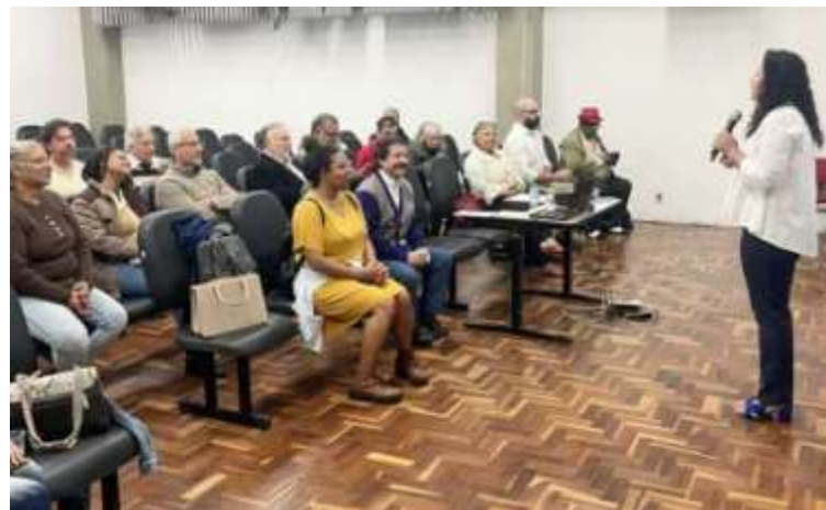
Conselho em Funcionamento.

A região contou ainda com a articulação de outros conselhos e órgãos colegiados, listados a seguir: Cades: fiscalizar o cumprimento da legislação ambiental, denunciar crimes ambientais às autoridades responsáveis pela área, interagir, orientar e realizar ações de conscientização com munícipes,