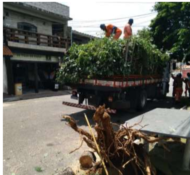
Serviço de Manejo de árvore em São Mateus.

Os serviços que podem ser executados após a avaliação são os seguintes: Poda; remoção; ampliação de canteiro; transplante; remoção de vegetação parasita, entre outros. Pode acontecer por necessidades técnicas e de segurança.