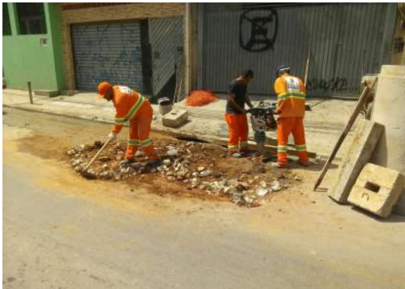
Serviço de Manutenção de Logradouros

Os serviços de logradouros consistem na conservação e manutenção de calçadas, guias, sarjetas e sarjetões e os serviços de galerias consistem na conservação e manutenção de dispositivos de drenagem, como sarjetas, bocas de lobo, poços de visita e seus ramais.