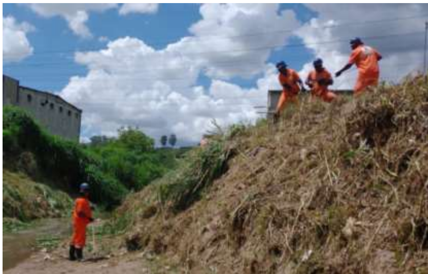
Serviço de Limpeza de córrego em São Mateus

Atualmente a cidade possui aproximadamente 50 estruturas de contenção que podem ser classificados entre piscinões e polders, construídos em locais estratégicos da cidade, como nas pontes da Marginal Tietê e a locais próximos a rios e córregos, como no curso do rio Aricanduva e do córrego Pirajussara.