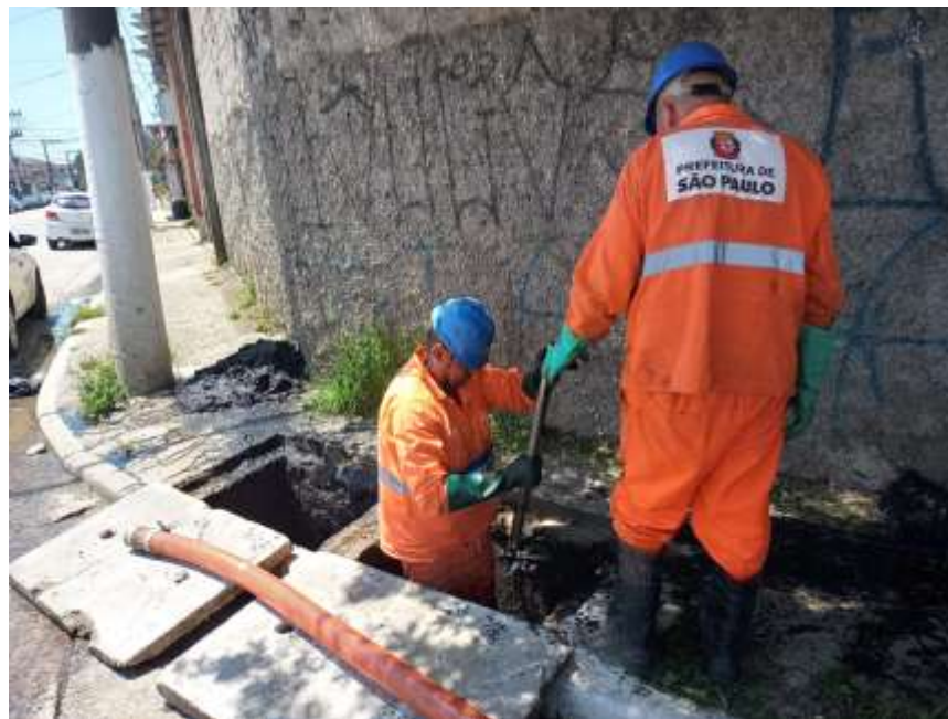
Serviço de Microdrenagem.

O trabalho de limpeza da rede de microdrenagem é importante para a adequada coleta e condução de águas pluviais, evitando alagamentos e entupimentos em vias públicas, proporcionando assim, maior segurança a pedestres e motoristas nas ruas e avenidas.