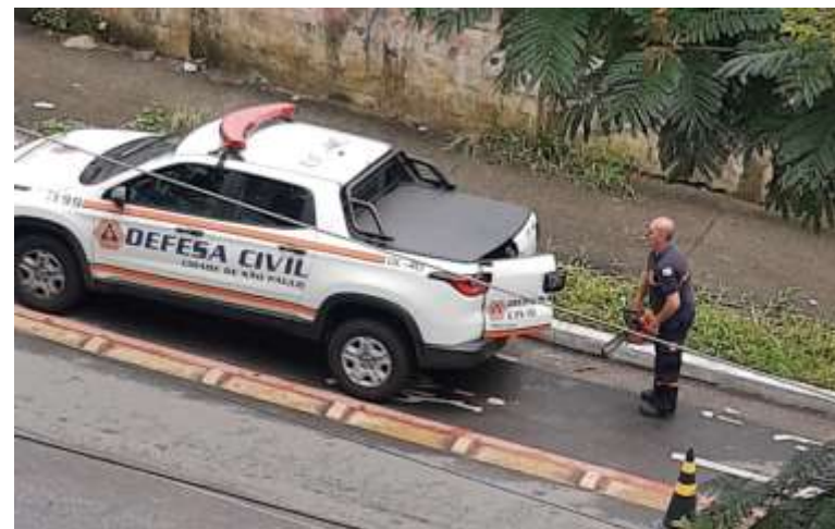
Ação de defesa civil

A atuação da Defesa civil tem o objetivo de reduzir os riscos de desastres. Também compreendendo ações de prevenção, mitigação, preparação, resposta e recuperação. Sempre que o cidadão sentir-se inseguro em relação a desastres naturais, enchentes, alagamentos, desmoronamentos, escorregamentos de terras, vazamentos de produtos químicos e combustíveis, ou exposto a situações de risco que exijam a atuação de profissionais, podem solicitar os serviços da defesa civil.