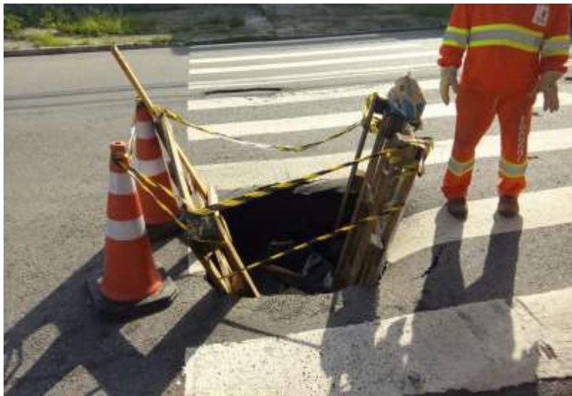
Serviço de Tapa Buraco em São Mateus.

O serviço é iniciado com o recorte da área no entorno do buraco, depois é realizada a fresagem do pavimento, ou seja a remoção do asfalto desgastado, em seguida o recorte é preenchido com asfalto novo, de forma nivelada ao pavimento existente.