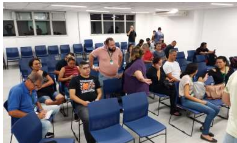
Exemplo de Conselho em Funcionamento.

Consegs – 49°DP, 69°DP e 55°DP – receber relatos da população sobre segurança, orientar o munícipe sobre a segurança, realizar palestras com especialistas no setor, interagir com a Subprefeitura, na criação de medidas que representem proteção