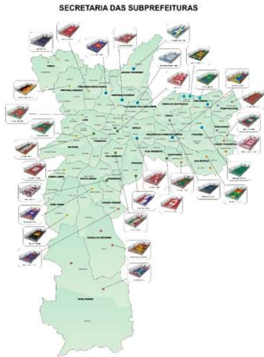
Mapa com a localização das quadras.