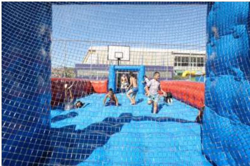
CEU Alto Alegre.

A Secretaria Municipal de Cultura é responsável por planejar e implantar as políticas de apoio e incentivo à cultura, mas a Subprefeitura pode apoiar o desenvolvimento dessas ações no seu território, por meio do apoio a produção cultural local nas diversas linguagens: música, teatro, dança, leitura, artes plásticas, cinema, entre outros.